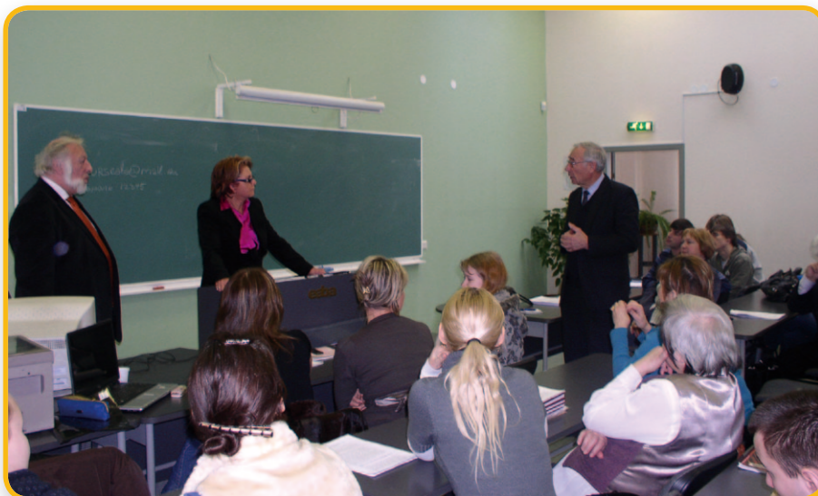
Открытая лекция депутата Европарламента Сийри Овиыр в стенах ЕАВА

одним словом, будут созданы все условия для того, чтобы студенты могли полностью посвятить себя учебе.