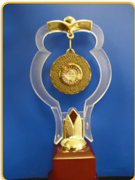
Медаль Cum Laude